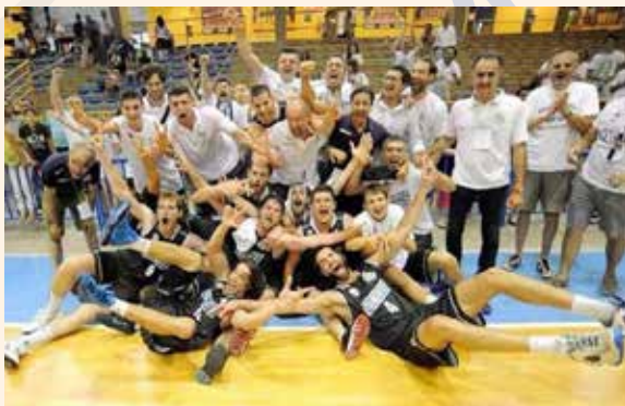
2014 promozione Serie A2 Silver