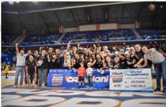
2019 Supercoppa LNP