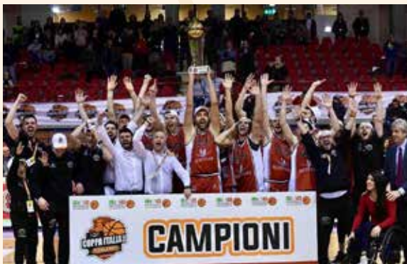
2018 Coppa Italia A2